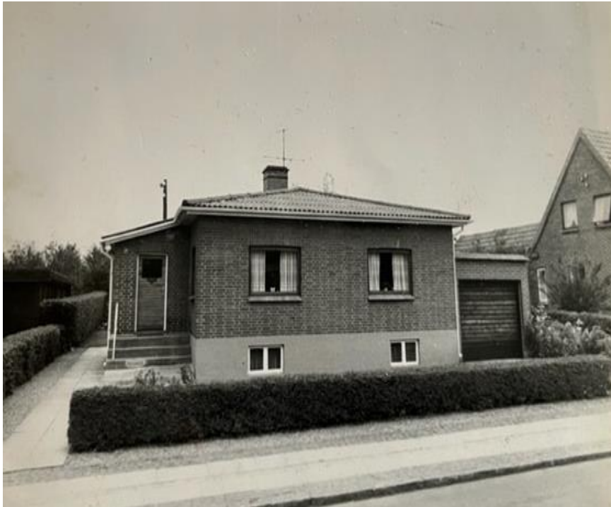
Dalgasgade 29, Trolldhede