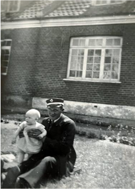
Else og hendes far i haven på Svinget