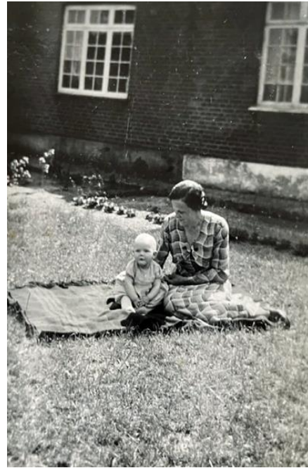
Else og hendes mor i haven på Svinget