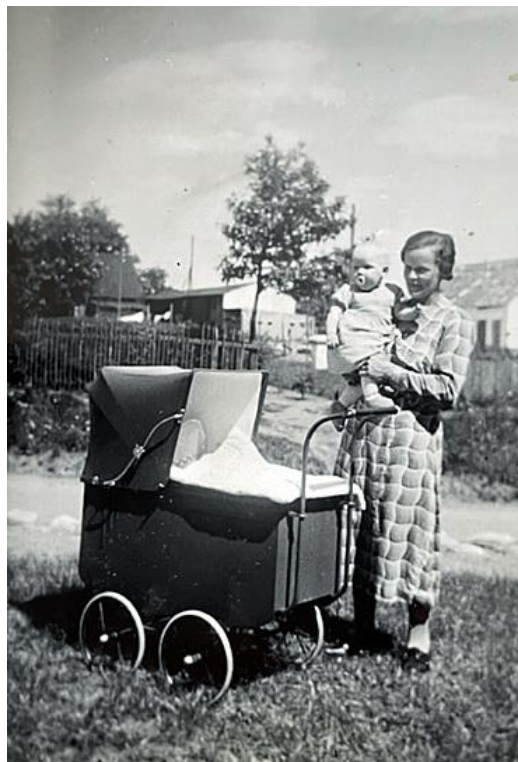
Else på armen af sin mor