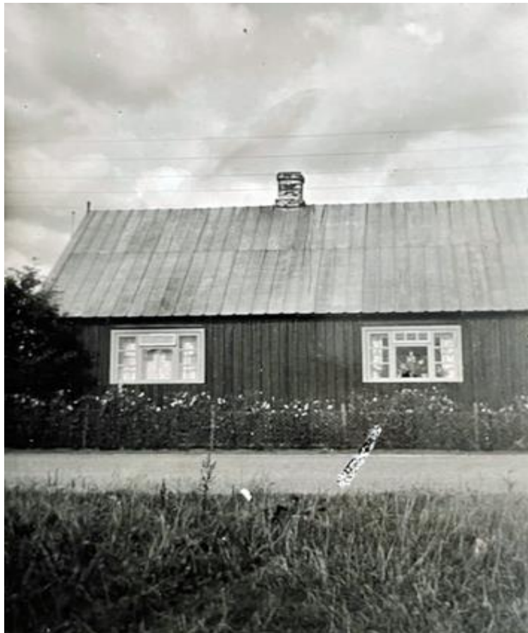
Huset på Dalgasgade nr. 22