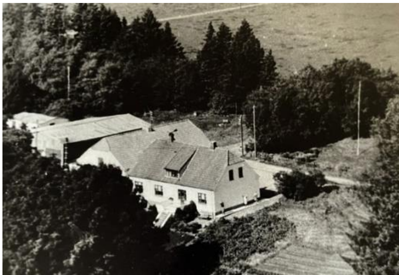
Skovfogedboligen Bjørslev plantage